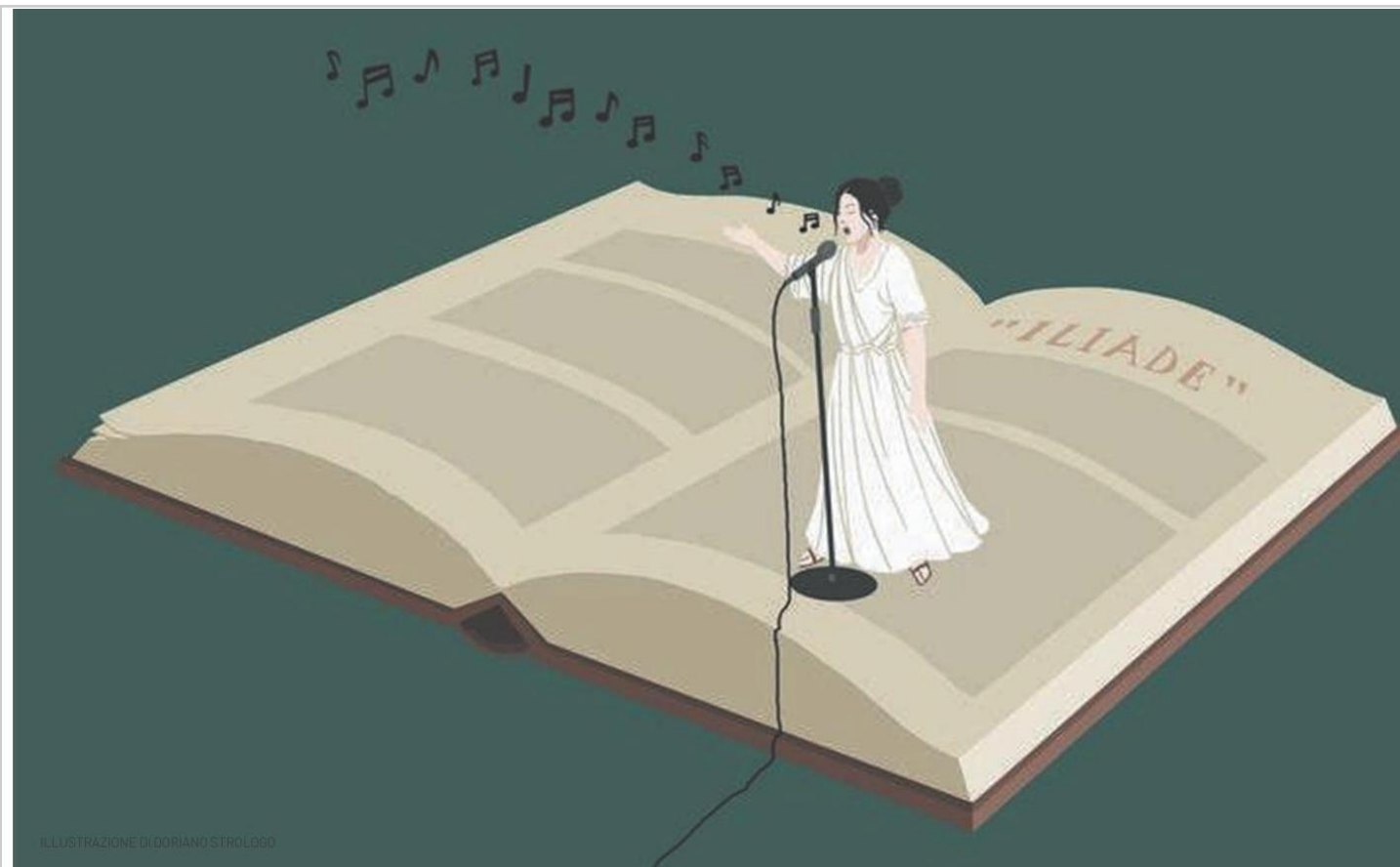
ILLUSTRAZIONE DI DORIANO STROLOGO

La proprietà intellettuale è riconducibile alla fonte specificata in testa alla pagina. Il ritaglio stampa è da intendersi per uso privato